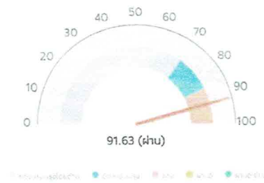
ผลการประเมินในภาพรวม

จากผลการประเมิน ในปีงบประมาณ พ.ศ. ๒๕๖๘ ของเทศบาลตำบลประจันตคาม ใน ภาพรวมได้รับคะแนนประเมิน ๙๑.๖๓ คะแนน เกณฑ์การประเมินอยู่ในระดับ ผ่าน ดังภาพผลการประเมิน ภาพรวม